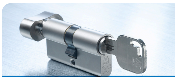
De Anker DOMESTIC knop cilinder met comfortabele draaiknop voor bediening zonder sleutel aan de binnenzijde