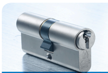
De Anker DOMESTIC dubbele cilinder standaard met SKG** en PKVW