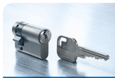
De Anker DOMESTIC enkele cilinder voor enkelzijdige afsluitingen