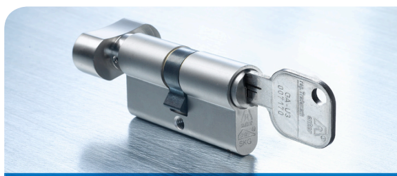
De Anker GA knopcilinder met comfortabele draaiknop voor bediening zonder sleutel aan de binnenzijde