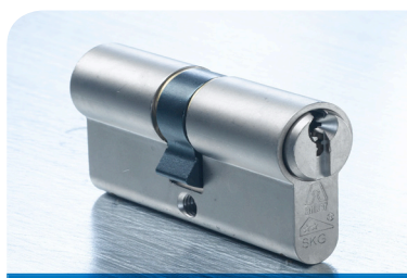
De Anker GA hele cilinder optioneel met SKG**