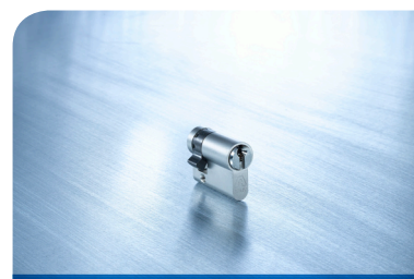
De Anker GA met tweeledig variabel sleutelprofiel tegen oneigenlijk dupliceren