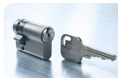
De Anker MULTI enkele cilinder voor enkelzijdige afsluitingen