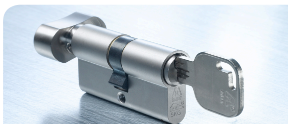
De Anker MULTI knop cilinder met comfortabele draaiknop voor bediening zonder sleutel aan de binnenzijde