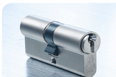
De Anker MULTI dubbele cilinder standaard met SKG**