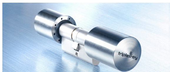
De Anker TRIPLE ENTRY knop-knop cilinder