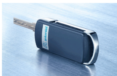
De Anker TRIPLE ENTRY sleutel