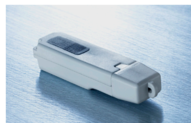
De USB router